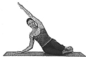
Nixe / Seitliches Beugen (Mermaid)