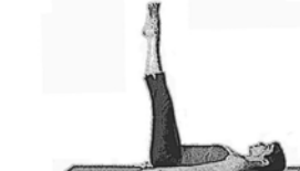
Der Korkenzieher (Corkscrew)