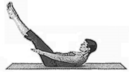
Die Hundert (The Hundred)