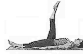
Kreisen mit einem Bein (Single Leg Circles)