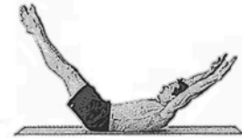
Dehnung mit beiden Beinen (Double Leg Stretch)