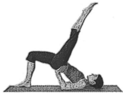
Schulterbrücke (Shoulder Bridge)