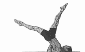
Die Schere (Scissors)