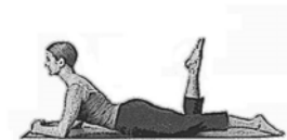
Ein-Bein-Treten (Single Leg Kick)