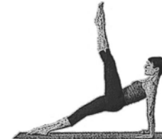
Beine hochziehen (Leg Pull Up)