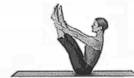
Der Schaukelstuhl (Open Leg Rocker)