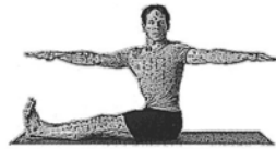
Drehung der Wirbelsäule (Spin Twist)