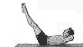
Gerade Dehnung mit beiden Beinen (Double Leg Stretch)