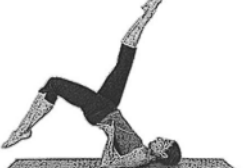
Das Fahrrad (Bicycle)