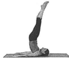
Das Klappmesser (Jack Knife)