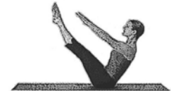
Teaser (Teaser Serie)

(24.11.2010) (ab 10. Stunde) seitlich Passé (klapp)